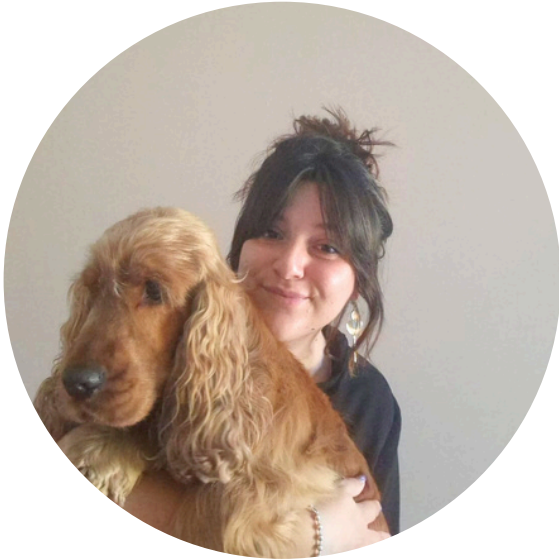
A mes côtés, c'est Gaston, la mascotte officielle d'i4FC !

"Le coaching, c'est comme une lampe torche : il éclaire votre chemin sans marcher à votre place."